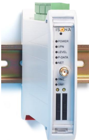
ISONA UMTS-Firewallrouter (Dual SIM)