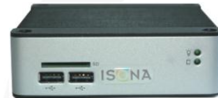
ISONA SEC55 VPN-Firewallrouter (3x LAN) (auch mit Hutschienenadapter lieferbar)