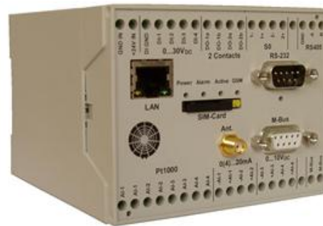
Datenlogger mit integriertem VPN-Router